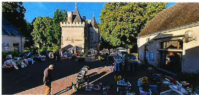
Brocante le 8 septembre 2024