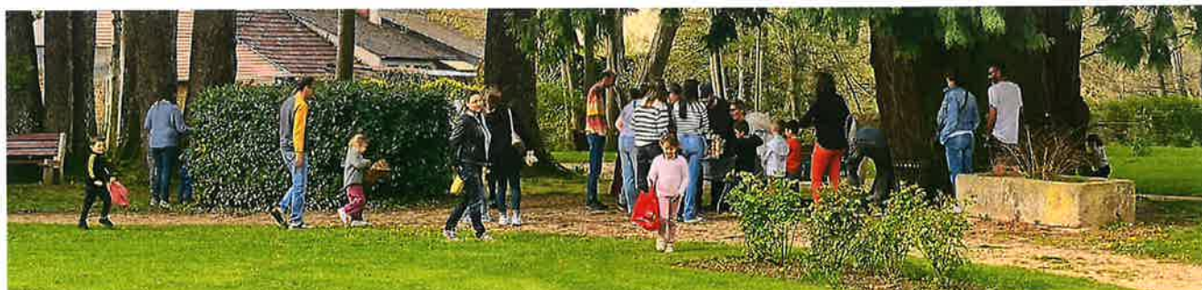
APEM, chasse aux œufs, avril 2024.